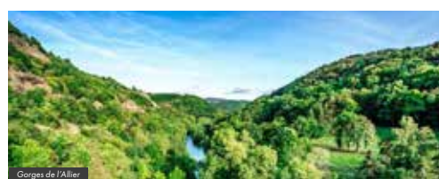
Gorges de l'Allier

Le parcours est bien vallonné et ponctué de nombreuses côtes assez courtes notamment sur le sud du Puy-de-Dôme et dans les Gorges de l'Allier en Haute-Loire. L'utilisation d'un V.A.E. permet d'envisager un tel parcours sans effort excessif. Les sections en voie verte arrivent progressivement.