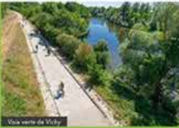
Via verte de Vichy

630 km De Nevers à l'océan Atlantique www.loireavelelo.fr