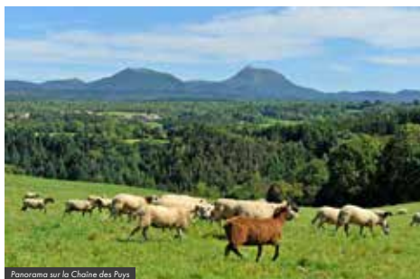
Panorama sur la Chaîne des Pays